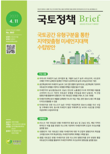
국토공간 유형구분을 통한 지역맞춤형 미세먼지대책 수립방안 국토연구원(KRIHS) / 2022