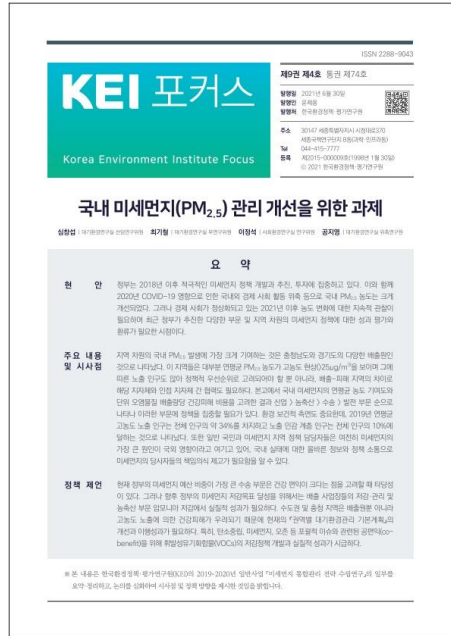
국내 미세먼지(PM2.5)관리 개선을 위한 과제 한국환경정책·평가연구원(KEI) / 2021