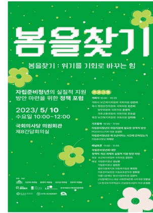
봄을찾기: 위기를 기회로 바꾸는 힘 조은희 의원실 / 2023