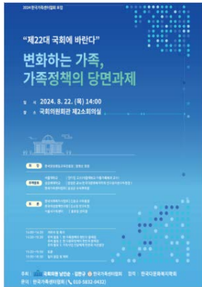
"제22대 국회에 바란다" 변화하는 가족, 가족정책의 당면과제 : 2024 한국가족센터협회 정책포럼 남인순 의원실, 김한규 의원실, 2025